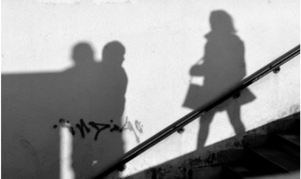
Majdnem szerelem 2025, fotográfia, 40 x 50 cm