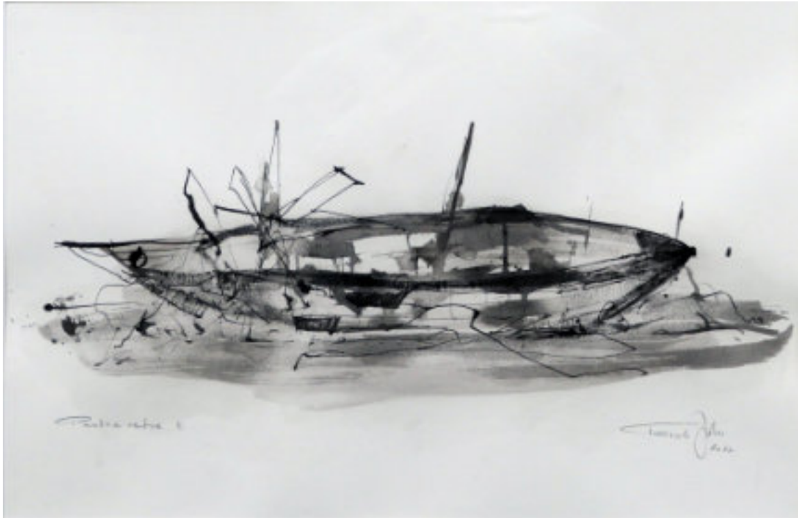
Partra vetve II. 2022, akril-vászon, 32 x 48 cm