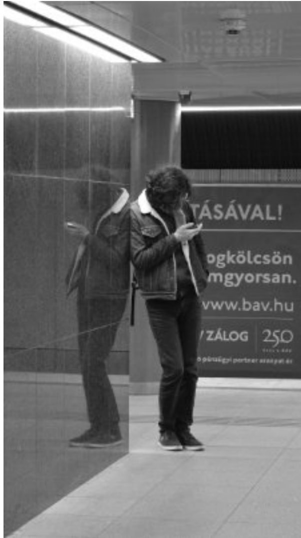
Metró magány 2023, fotográfia, 50 x 40 cm