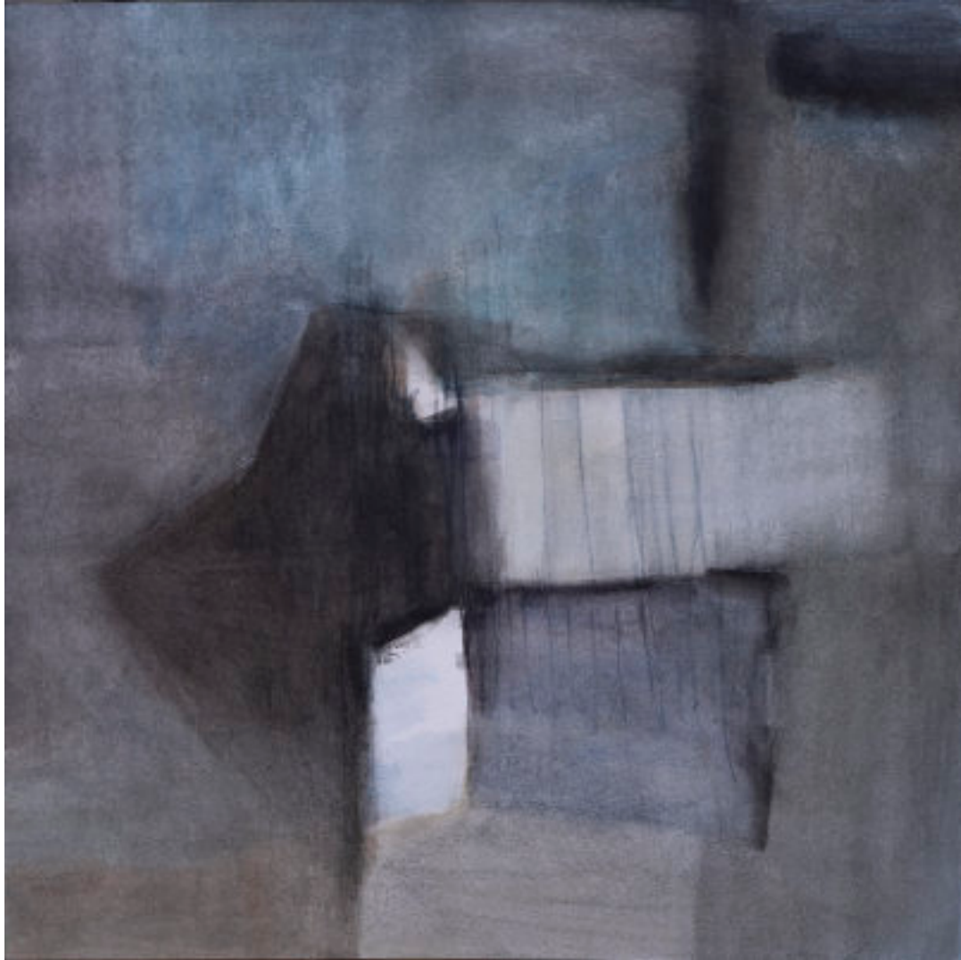
Két kocka II.

2021, akvarell, akvarellceruza, 64x61,5 cm