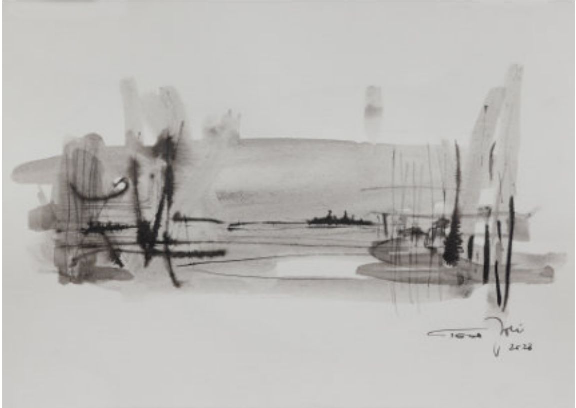
Folyópart II. 2023, papír, tus, 20 x 29 cm