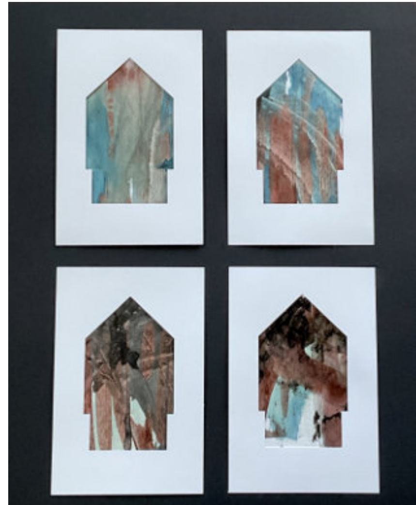
KIS SZÍNES BAGATELLEK 1- 4

2025, akril, zselé-print, 4 x 21 x 14 cm