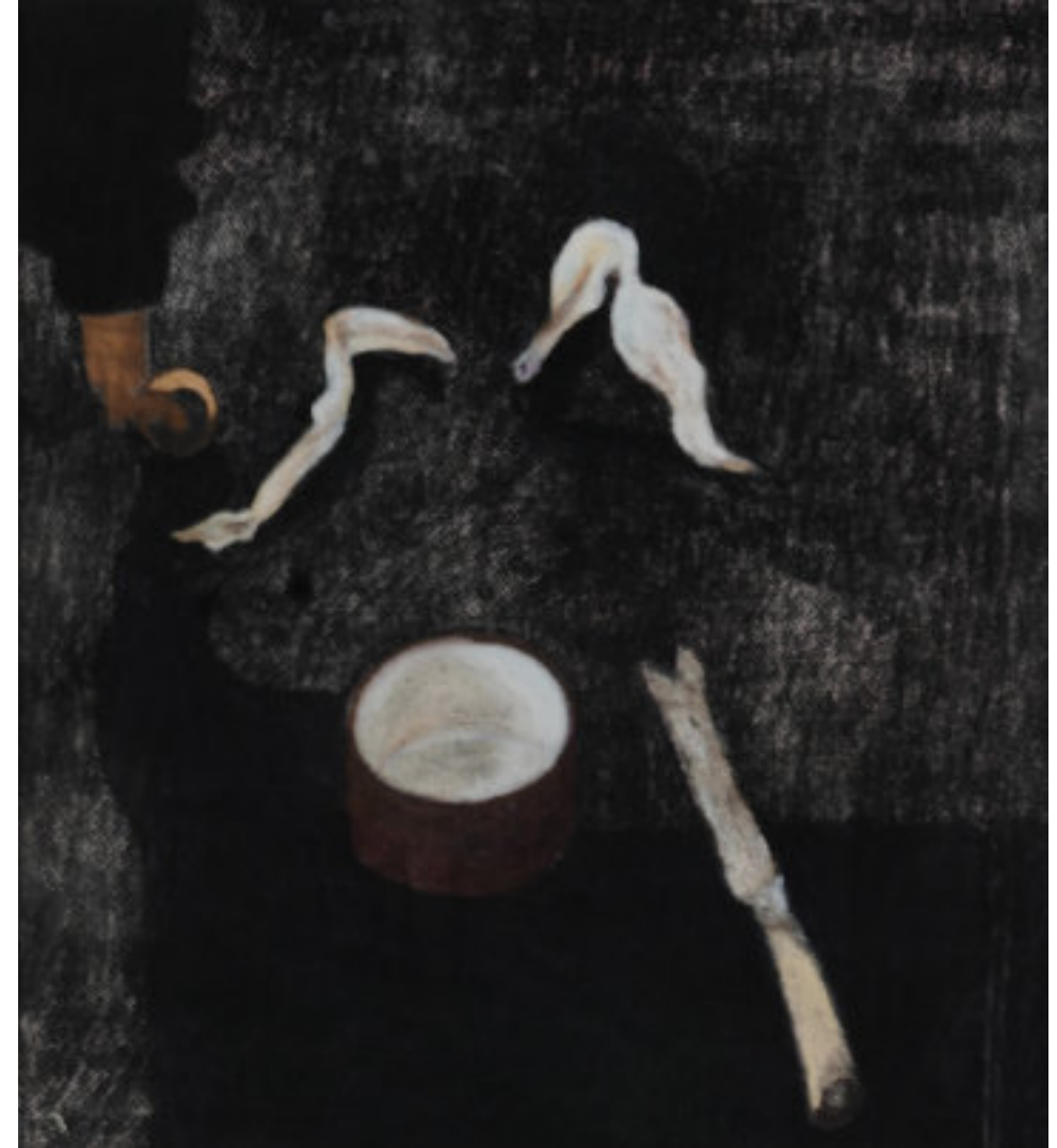
ZONGORALÁBAK KÉSEL, TÁLKÁVAL ÉS TULIPÁN LEVÉLLEL