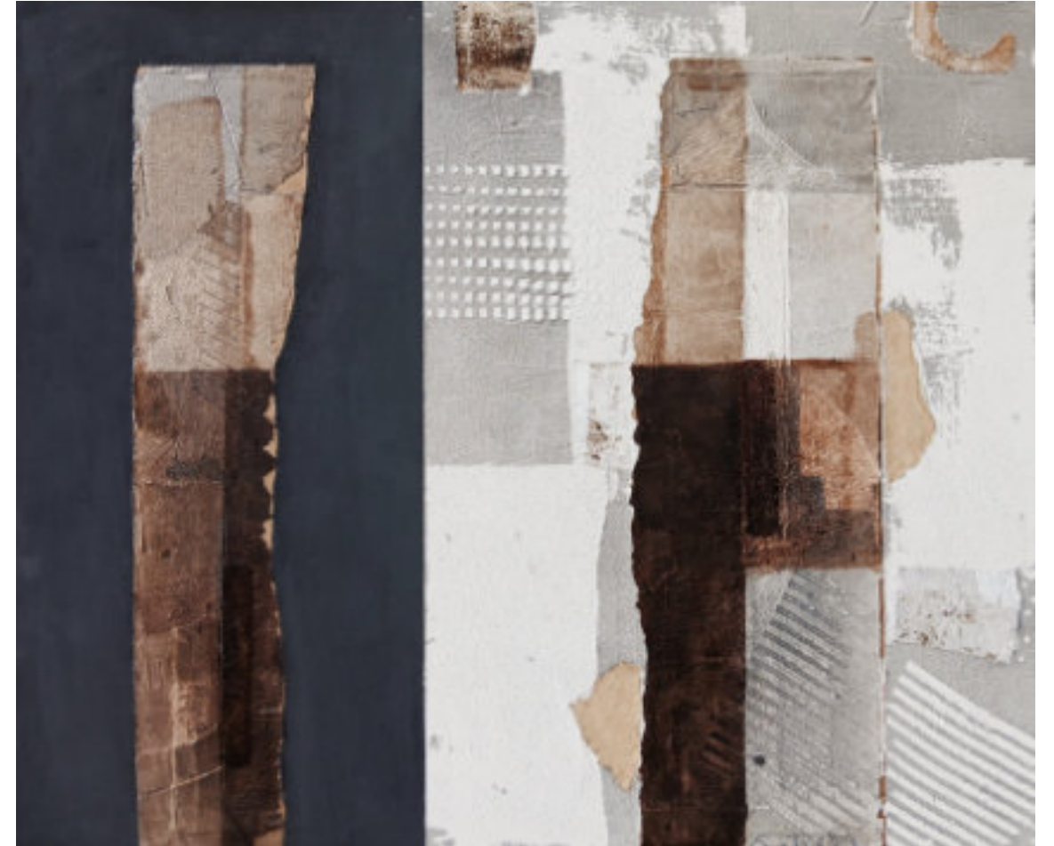
FÉNY ÉS ÁRNYÉK

2024, vegyes technika, vászon, 100 x 120 cm