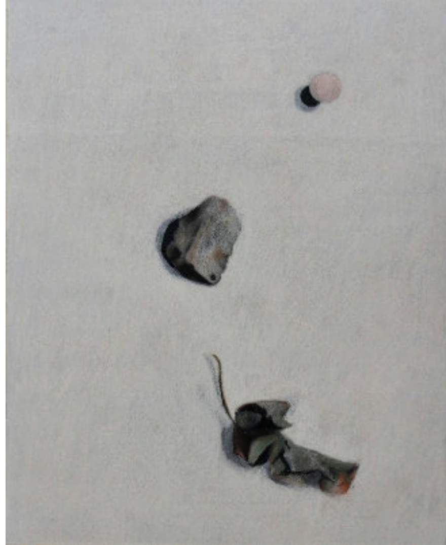
KŐ CSÁSZÁRFA LEVÉLLEL