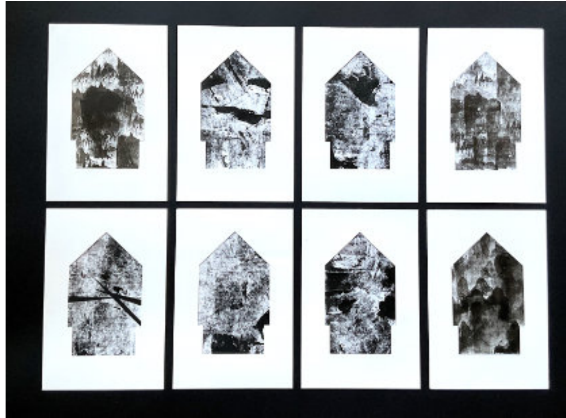
APRÓ BAGATELLEK 1 - 8

2025, akril, zselé-print, 8 x 21 x 14 cm