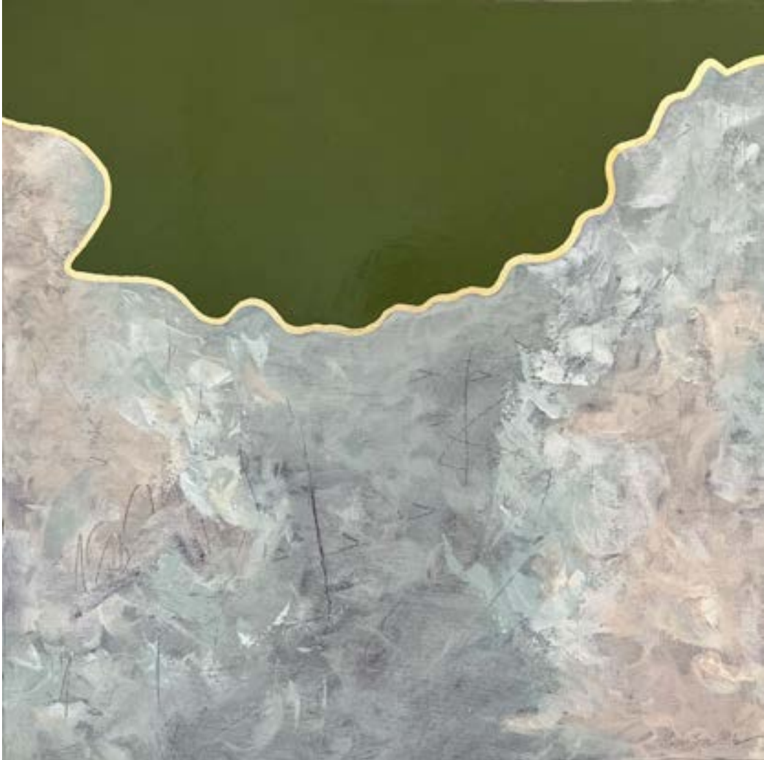
AZ ÖSSZEFOGÁS EREJE (TISZA) 2024, olaj, vászon, 60 x 60 cm