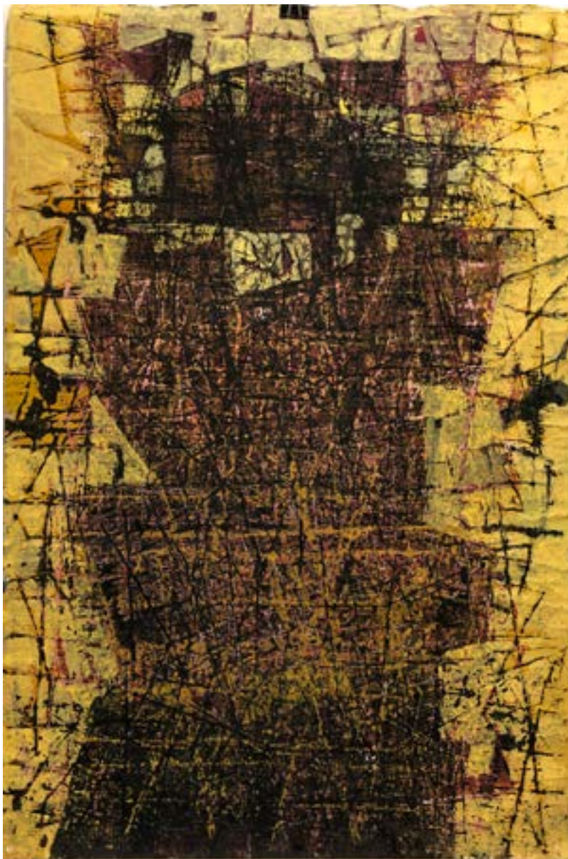
Az emeleten már nem laknak 120 x 80 cm, papírnymat, karton, 2021