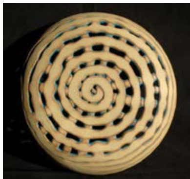
Útvesztő A, B, C, D, 2010. kőcserép, átm. 32 cm