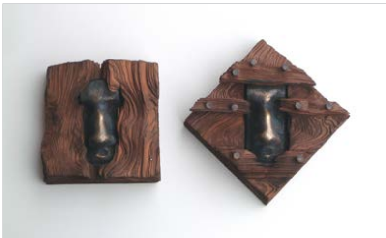
Krisztusi korba lépve I – II.