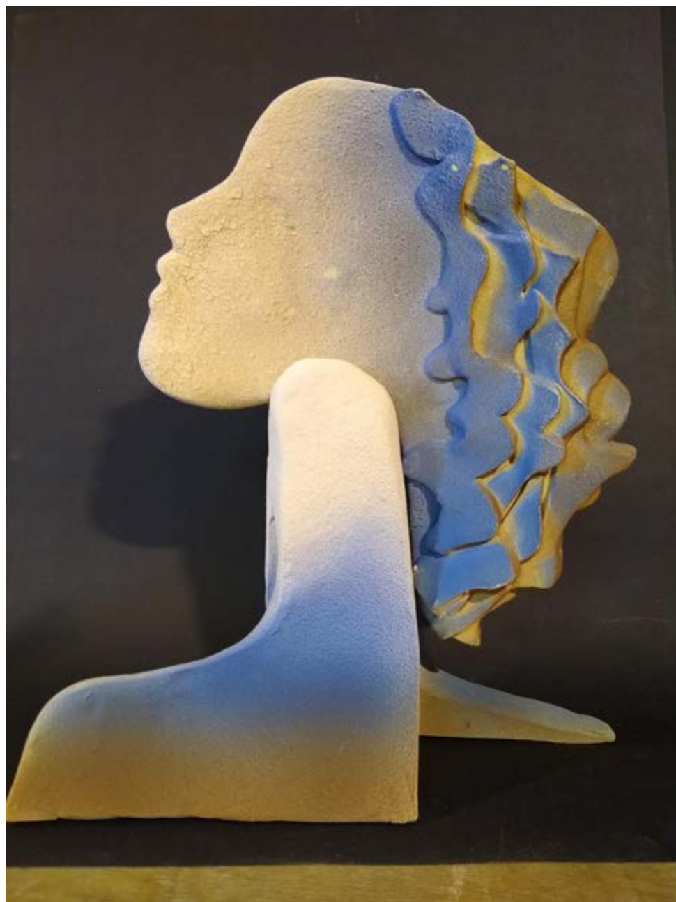
Csillagkereső, 2020. 35 x 12 x 30 cm mázás samott