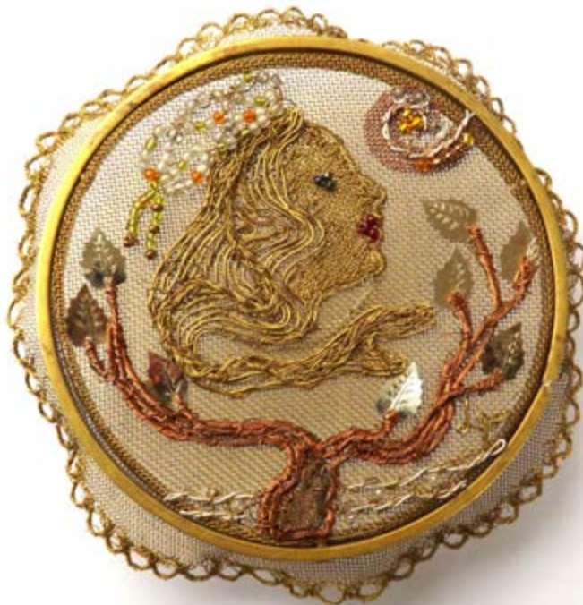
Magyar Ilona 2019. fémhímzés, 15 cm átmérő

A Magyar Iparművészeti Főiskolán 1973-ban diplomáztam, mint ötvösművész. 1974-től szabadfoglalkozású művészként saját műhelyemben dolgozok és rendszeresen részt veszek hazai és külföldi szakmai kiállításokon. Autonóm és alkalmazott fémplasztikákat egyaránt készítek. Címerek, cégérek, portrék, emlékdomborművek, díjplasztikák, érmek... tartozik tevékenységi területembe. Főként a fém légiyes formaalakítási lehetőségével élve arra törekszem, hogy a formáknak és az anyagnak az egysége és finom részletei lelkiséget tükrözzenek. Munkáimon szimbolikus tartalmak hordozói a fogalmi ábrázolással megjelenített motívumegyüttesek.