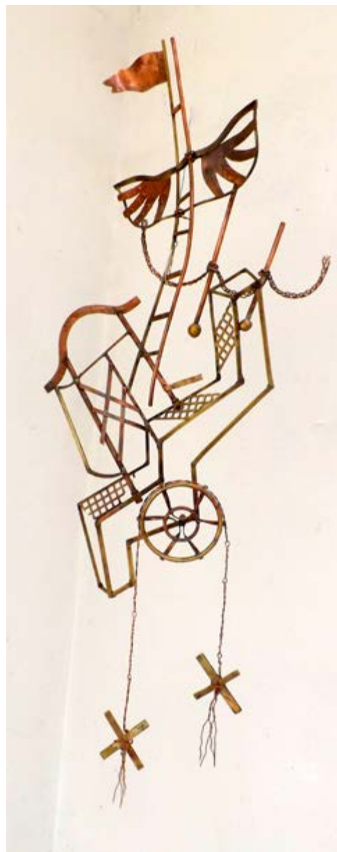
Igyekezet 2018. sárga- vörösréz, 95 x 37 x 14 cm