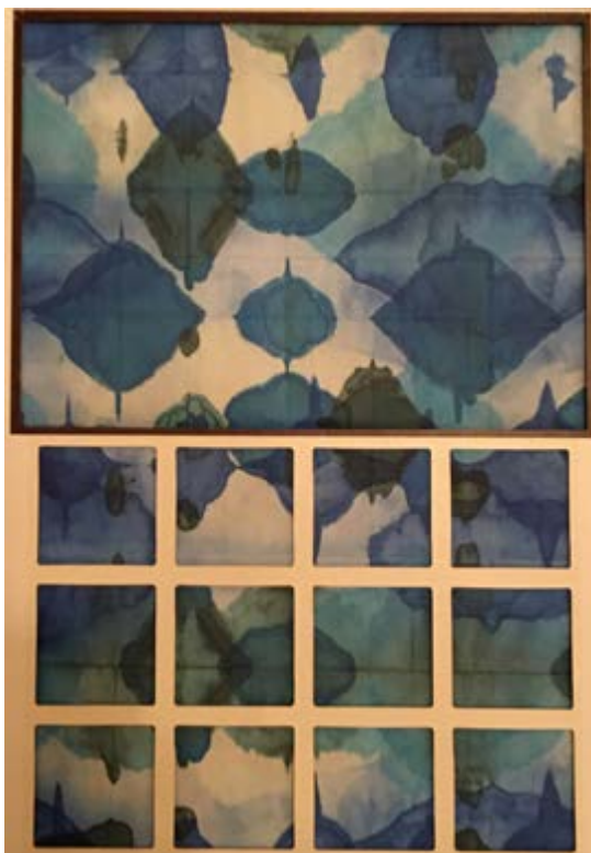
2021. január 6. 1, 2, 3, vegyes technika, 40 X 60cm