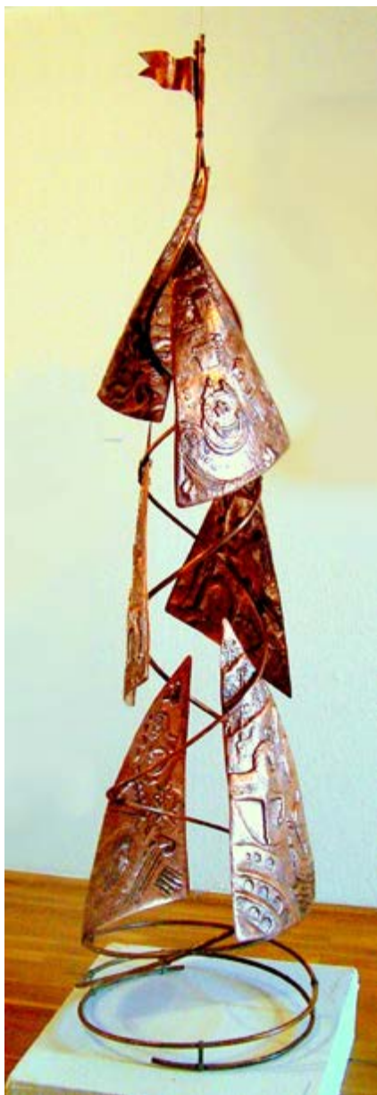
Időspirál I. 2007. vörösréz, 168 x 43 x 43 cm